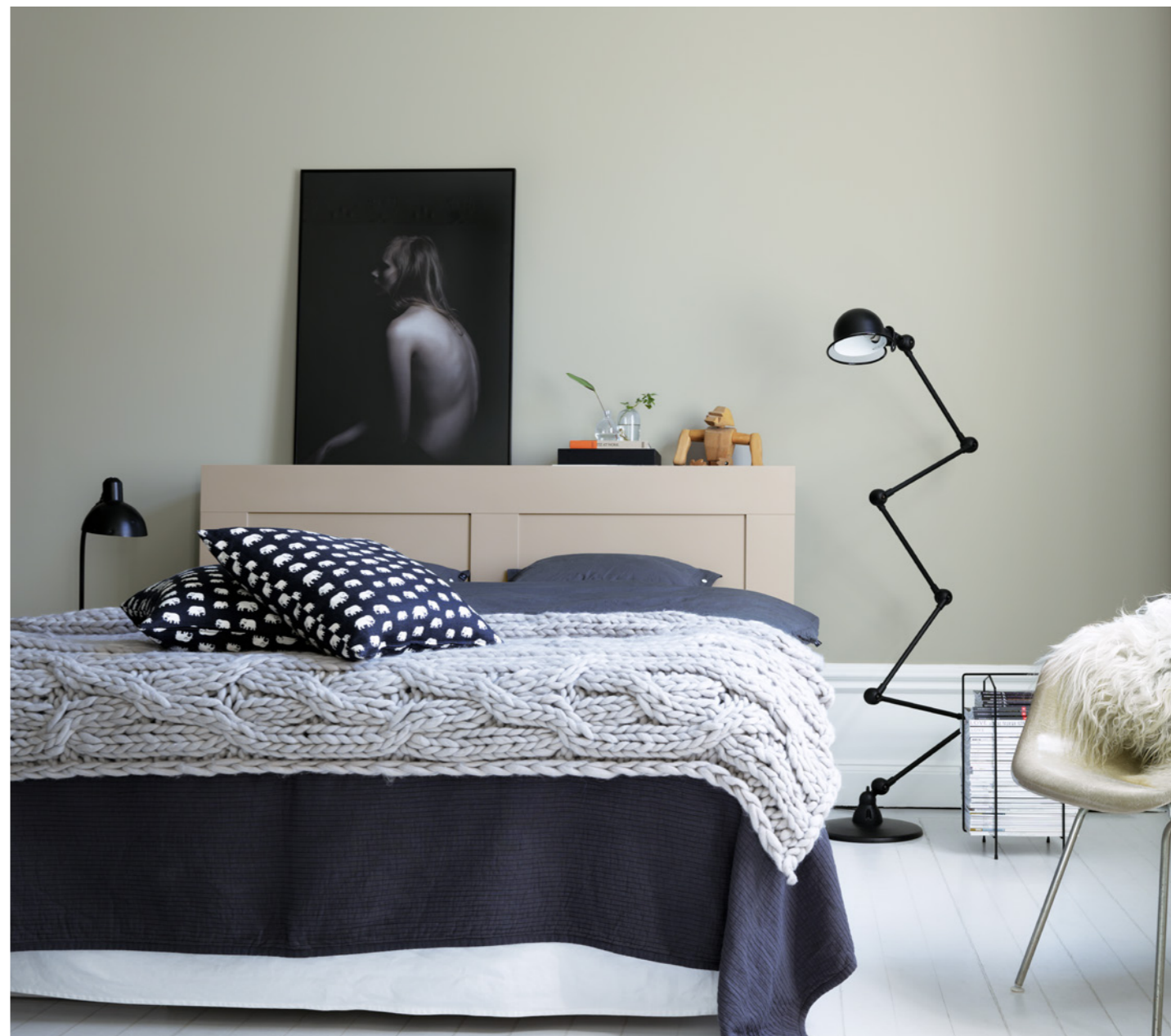
Vägg: Twilight 549, Sänggavel: Mohair 653.

Att ett litet färgprov inte upplevs riktigt på samma sätt som den stora färdigmålade väggen, vet du kanske. Men det finns fler saker som du bör tänka på innan du bestämmer dig. En varm kulör ger till exempel en ombonad känsla, medan en kall kulör ger ett lugnare intryck och kan få ett rum att kännas större.