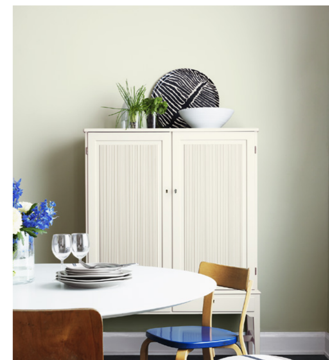
Vägg: Strå 821, Skåp: Mjolk 522.